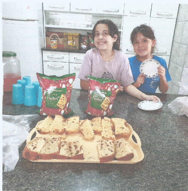
Lanche – dezembro 2024