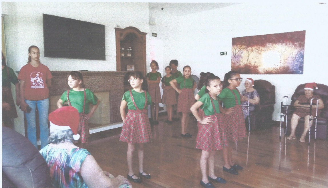
Apresentações nas Casas de repouso para idosos – Dezembro 2024

C.N.P. J (MF) Nº 48.961.361/0001-20 – CEP 12.061-000 – fone/Fax: (12) 3621-4430