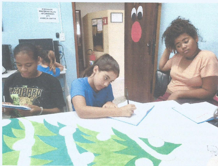
Desenho livre preparando a decoração de natal

C.N.P. J (MF) Nº 48.961.361/0001-20 – CEP 12.061-000 – fone/Fax: (12) 3621-4430