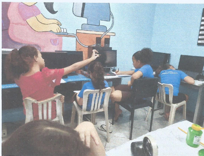
Aulas de informática